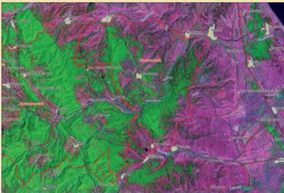
Космоснимок Каякентского заказника и его окрестностей

Государственный природный заказник регионального (республиканского) значения «Каякентский». Заказник расположен в Каякентском районе (административный центр – с. Ново-Каякент), в средней части бассейна реки Гамри-озень. Вдоль границ и внутри заказника расположены населенные пункты: Утамыш, Усимикент, Алхаджакент, Каякент, Башлыкент, Капкайкент, Джаванкент (Каякентский район) и Мамааул (Сергокалинский район).